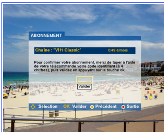
5/6 » 暗証番号を入力する