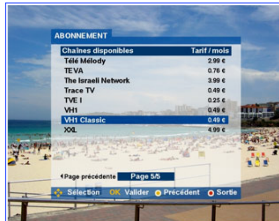
4/6 » 登録したいチャンネル/パッケージチャンネルを選択する