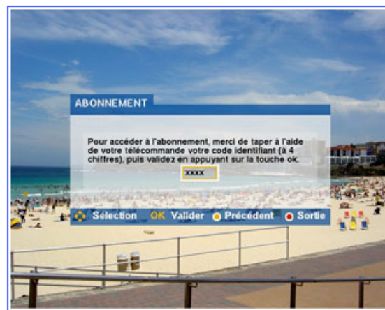
2/6 » 暗証番号を入力する