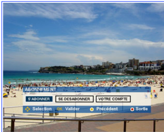
1/6 » 有料チャンネルを登録する