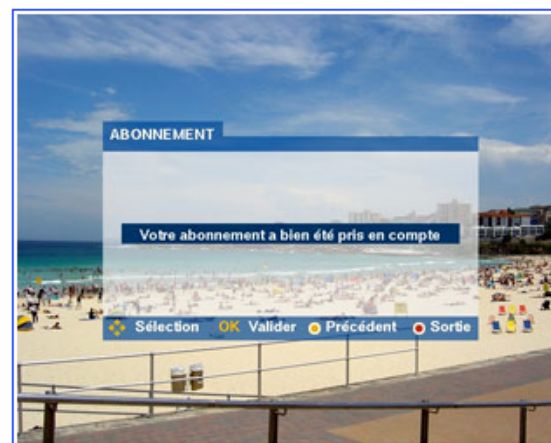
6/6 » 登録完了メッセージ画面